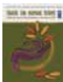
Fefaatauaiga i Tuutuuga Tau le Tagata Toe fesuiiaiga o Fefaatauaiga mo le Atinae mo Tagata i Asia ma le Pasefika