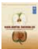
Faiga e foia ai Faiga tauvalea: Toe suiga o le Olaga Faatelevave o le Atinae mo Tagata i Asia ma le Pasefika