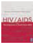
Faamai oti ma le Atinae i Asia i Saute