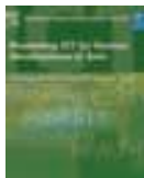
Uunaia o ICT mo le Atinae i Asia Aloaia o Sini o Atinae o le Meleniuma